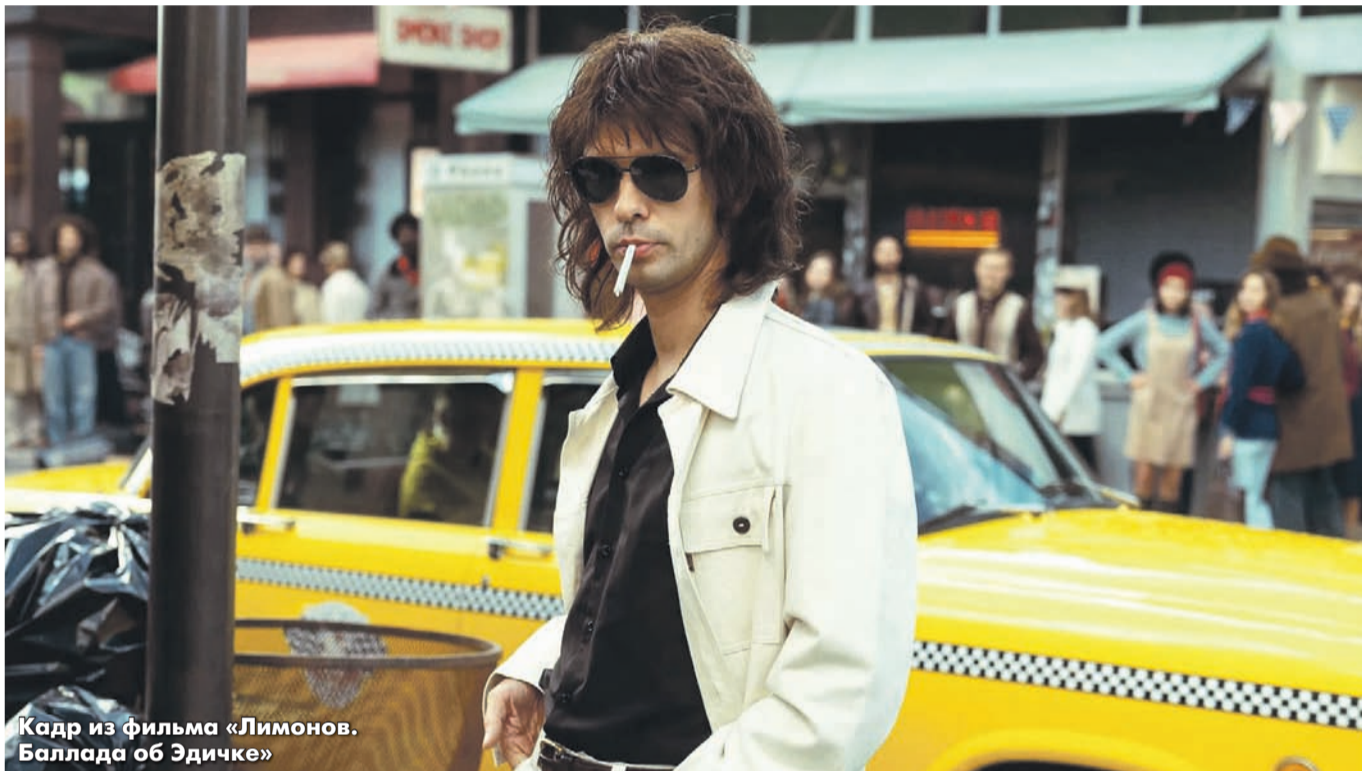
Кадр из фильма «Лимонов. Баллада об Эдичке»

КАННЫ УВИДЕЛИ И ОЦЕНИЛИ НОВУЮ РАБОТУ КИРИЛЛА СЕРЕБРЕННИКОВА