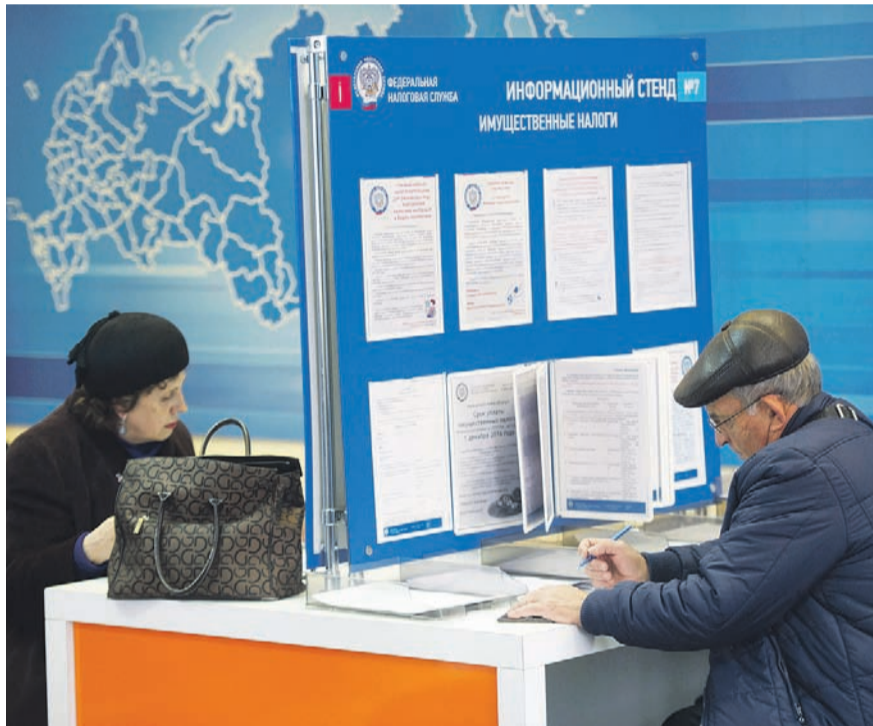
Кирилл КУХМАРЬ / ТАСС

P. S. Повышение налогов не коснется тех, кто имеет отношение к СВО и «оборонке».