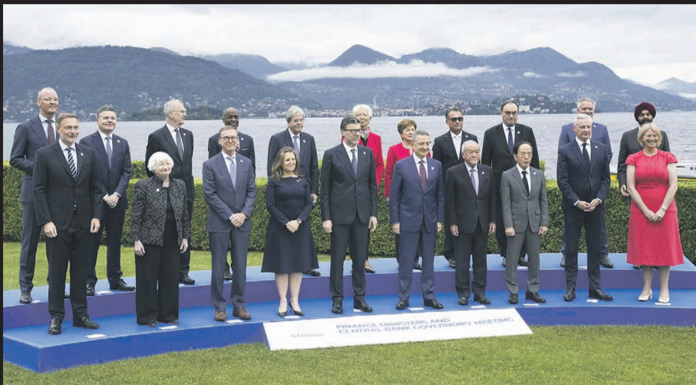
Встреча министров финансов стран «Большой семерки» в Стрезе

ЕВРОСОЮЗ ЗАПЛАТИТ УКРАИНЕ ПРОЦЕНТАМИ С РОССИЙСКИХ ЗАМОРОЖЕННЫХ АКТИВОВ. ЮРИДИЧЕСКИЕ ОЦЕНКИ ЭТОЙ АКЦИИ РАЗНЫМИ СТОРОНАМИ СИЛЬНО РАЗЛИЧАЮТСЯ