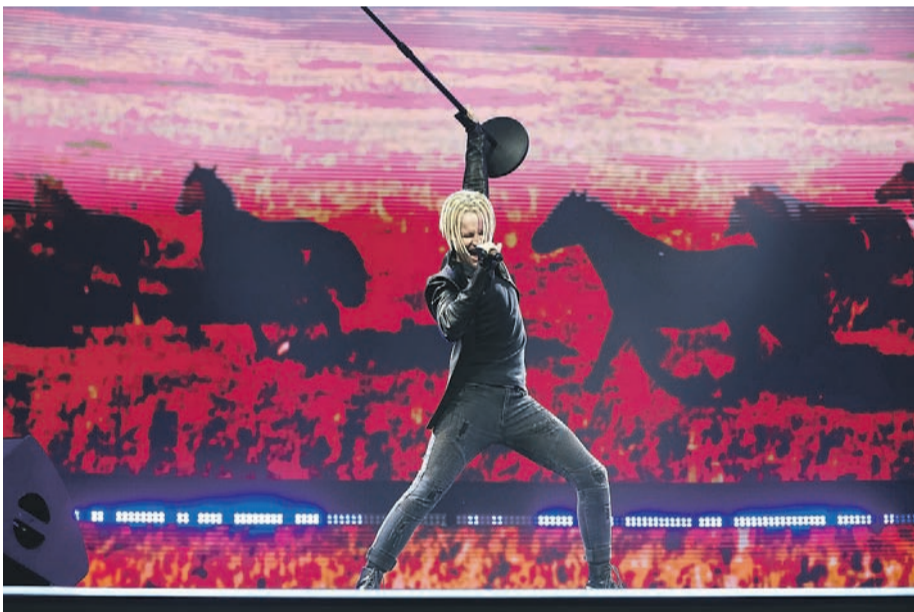
Сергей ВЕДЯШКИН / Агентство Москва