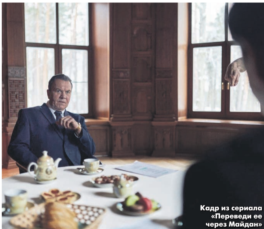
Кадр из сериала «Переведи ее через Майдан»

О ценности для искусства нового кино могу сказать лишь одно: каждому зрителю, досмотревшему упомянутые сериалы до конца, следует выдавать награду типа «Золотого орла», не меньше. Самое интересное, что политические события, о которых они повествуют, значатся лишь на уровне символа. Зрители федеральных каналов давно уже обучены тому, как правильно относиться к Украине, к распаду Советского Союза, к коллективному Западу. Осталось только выдумать убойный сюжет. В центре, извините