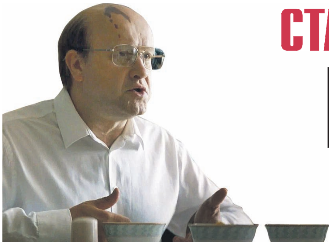
Кадр из сериала «ГДР»