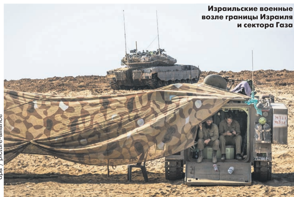
Израильские военные возле границы Израиля и сектора Газа

— ХАМАС все эти годы получал довольно большие деньги со всего мира. В 2018 году США грозили перестать выделять им ежегодные 200 миллионов долларов. Евросоюз выделяет Газе 691 миллион евро в год. Отдельно им перечисляет деньги Израиль. И все это — на регион с населением два миллиона человек. При этом там нищета полная. На что эти деньги идут?