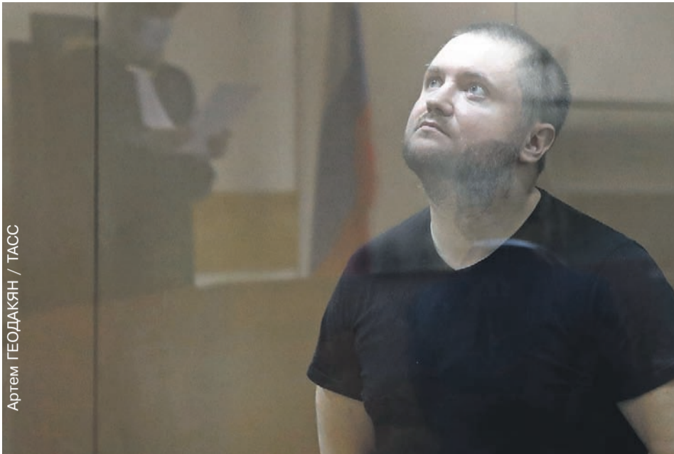
Артем ГЕОДАКЯН / ТАСС