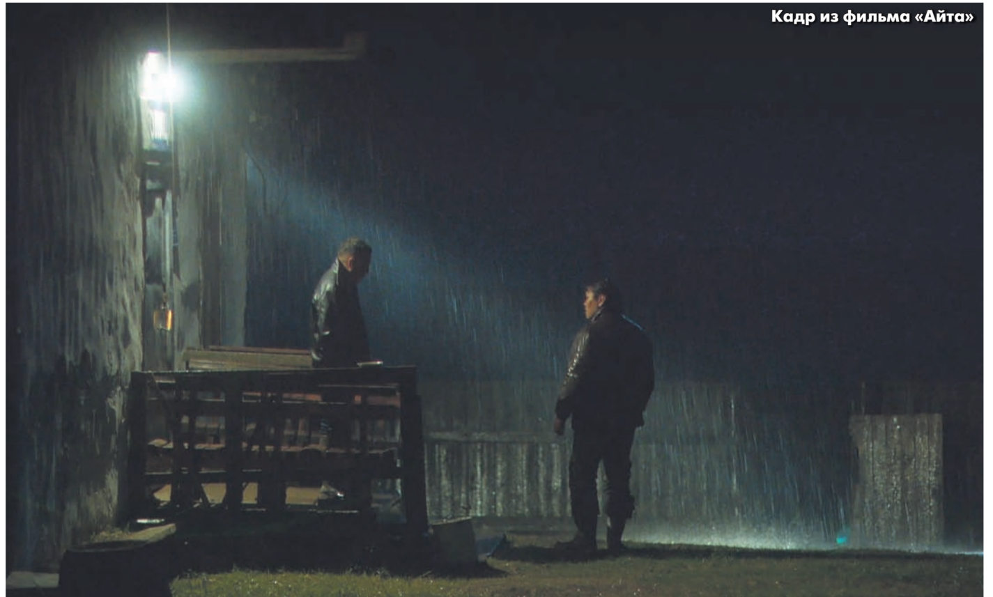
Кадр из фильма «Айта»

И люди приняли и поняли картину, она стала лидером якутского проката. Ее взяли в свои библиотеки российские онлайн-платформы. Якутское кино, кажется, начало выходить из гетто республиканского проката на федеральный простор, тем самым подтверждая мысль о равенстве авторов вне зависимости от их проживания, удаленности от центра.