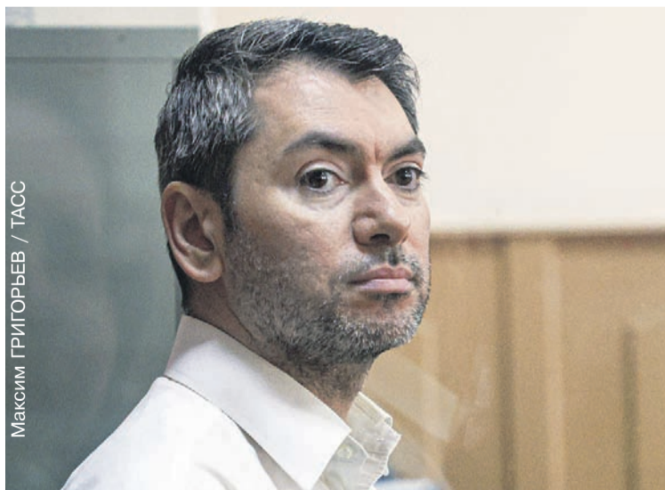
Максим ГРИГОРЬЕВ / ТАСС

«Ваша честь, я раскаиваюсь в своих словах. Прошу понять и простить меня. Мое состояние на момент звонков было состоянием аффекта. Я хочу вернуться к семье. Я честный офицер, который служил при законе».