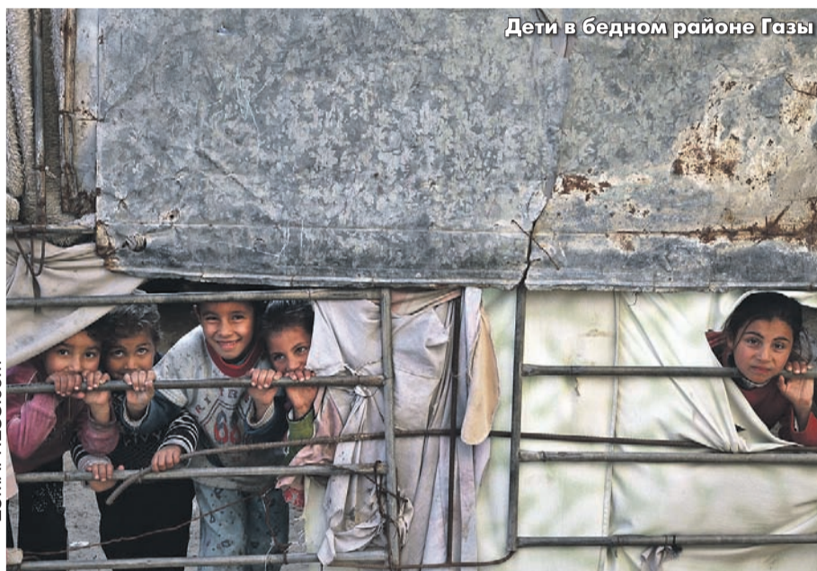
Дети в бедном районе Газы