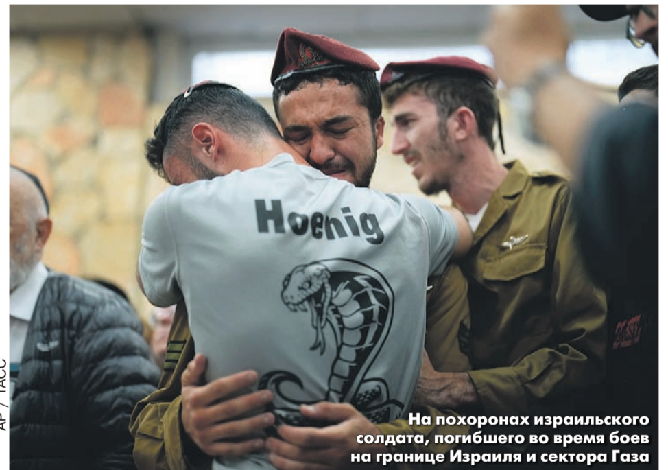
На похоронах израильского солдата, погибшего во время боев на границе Израиля и сектора Газы

А ведь дело не ограничивается ХАМАС: только что спецпредставитель президента России по Афганистану, ди-