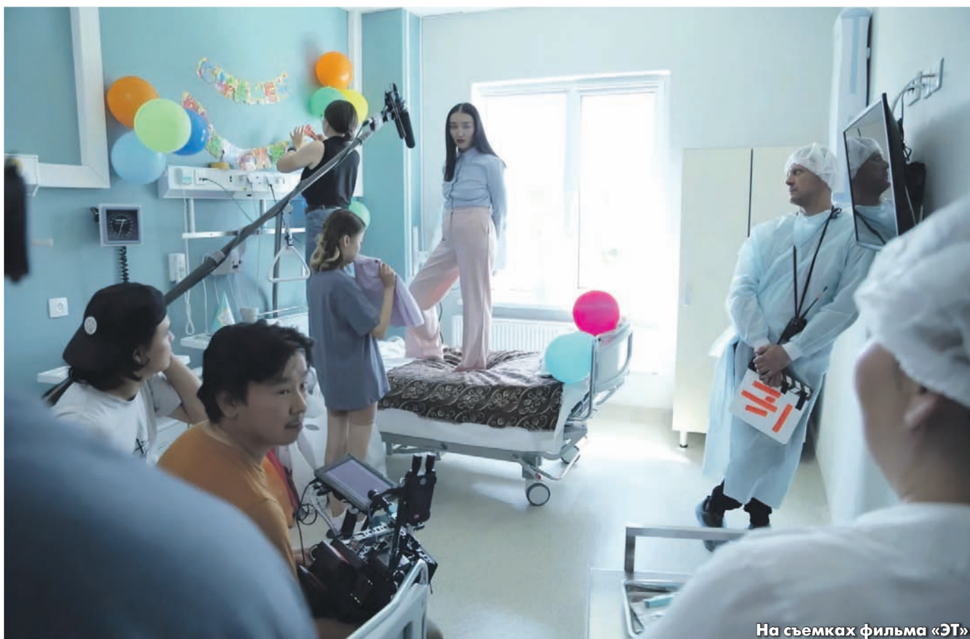
На съемках фильма «ЭТ»

«» ТОПОР ЗАПРЕТА ПАДАЕТ ПОЧТИ РАНДОМНО — ПО ЗАКОНУ РЕПРЕССИЙ. ТРУДНО ПРЕДПОЛОЖИТЬ, КТО ИЛИ ЧТО МОЖЕТ ОКАЗАТЬСЯ СЛЕДУЮЩЕЙ ЖЕРТВОЙ