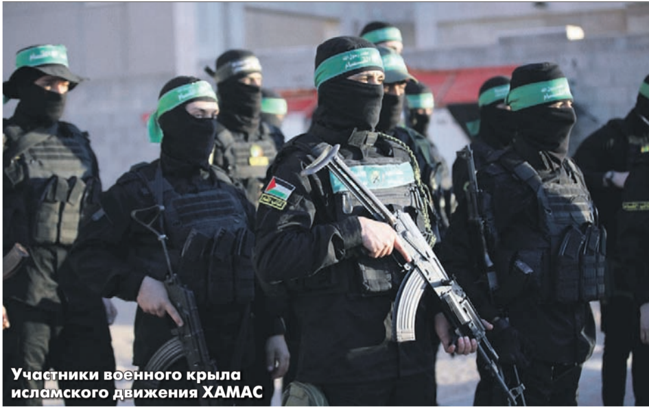
Участники военного крыла исламского движения ХАМАС

Mahmoud Ajjour / Keystone Press Agency / Global Look Press