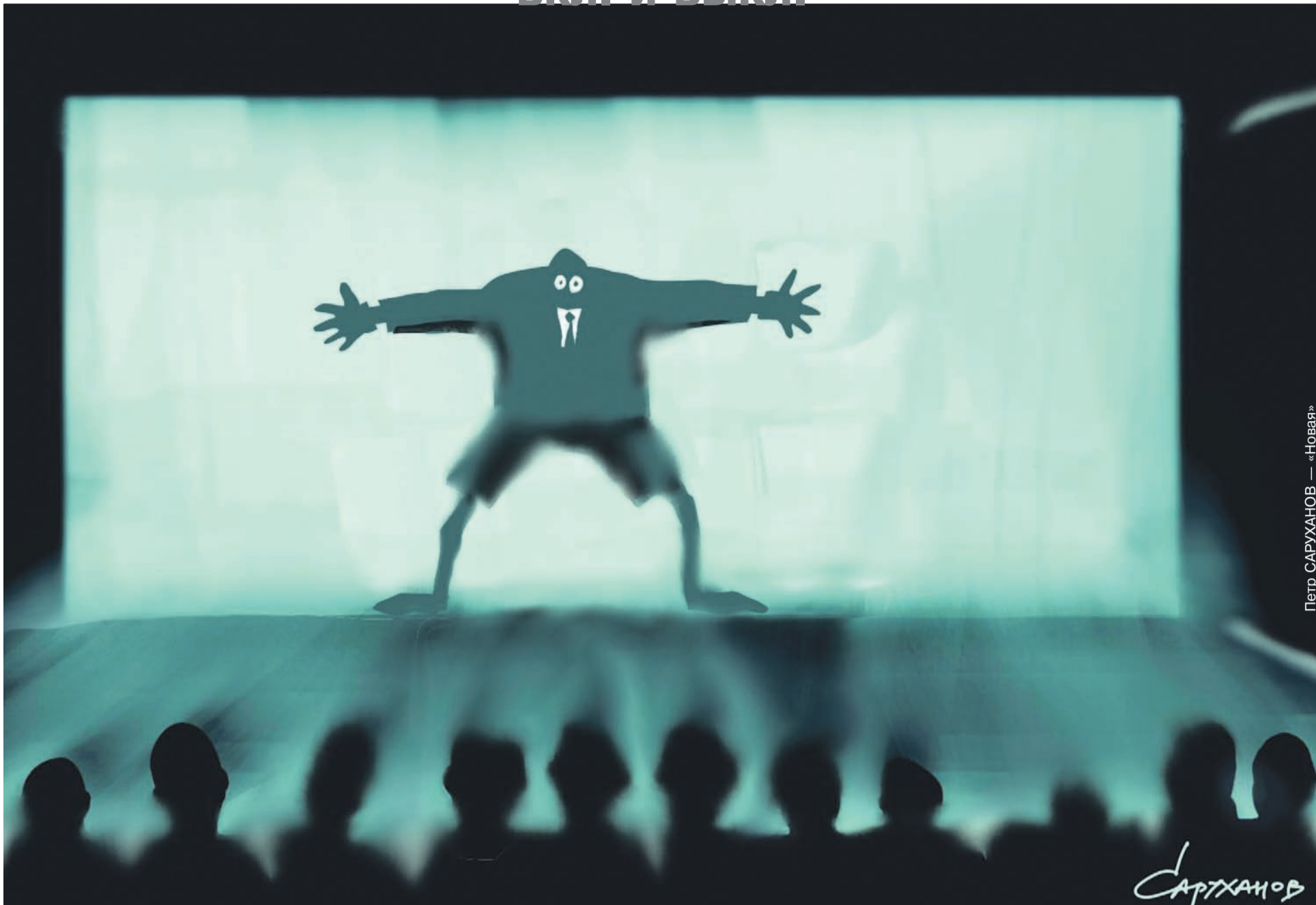
Петр САРУХАНОВ — «Новая»