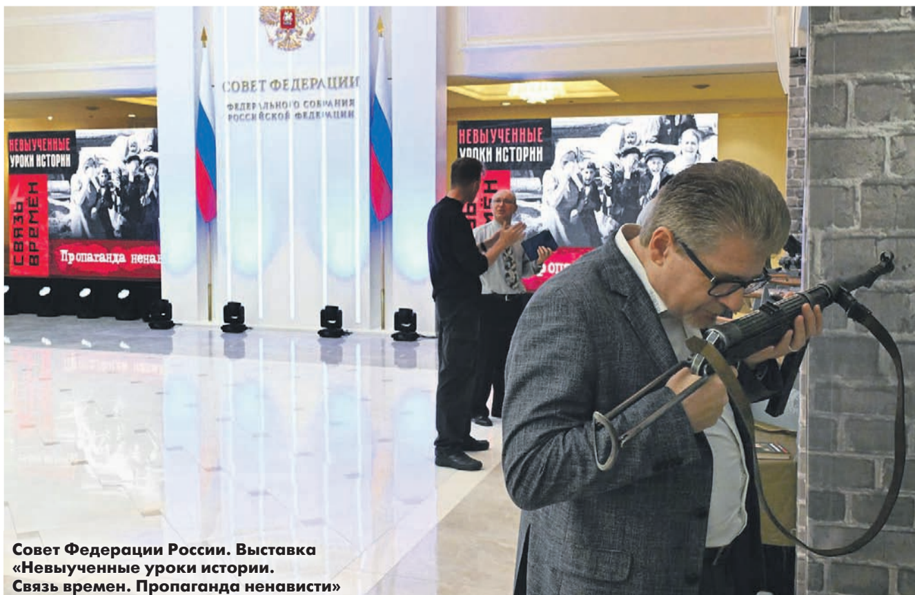
Совет Федерации России. Выставка «Невыученные уроки истории. Связь времен. Пропаганда ненависти»

*Внесен властями РФ в реестр «иноагентов».