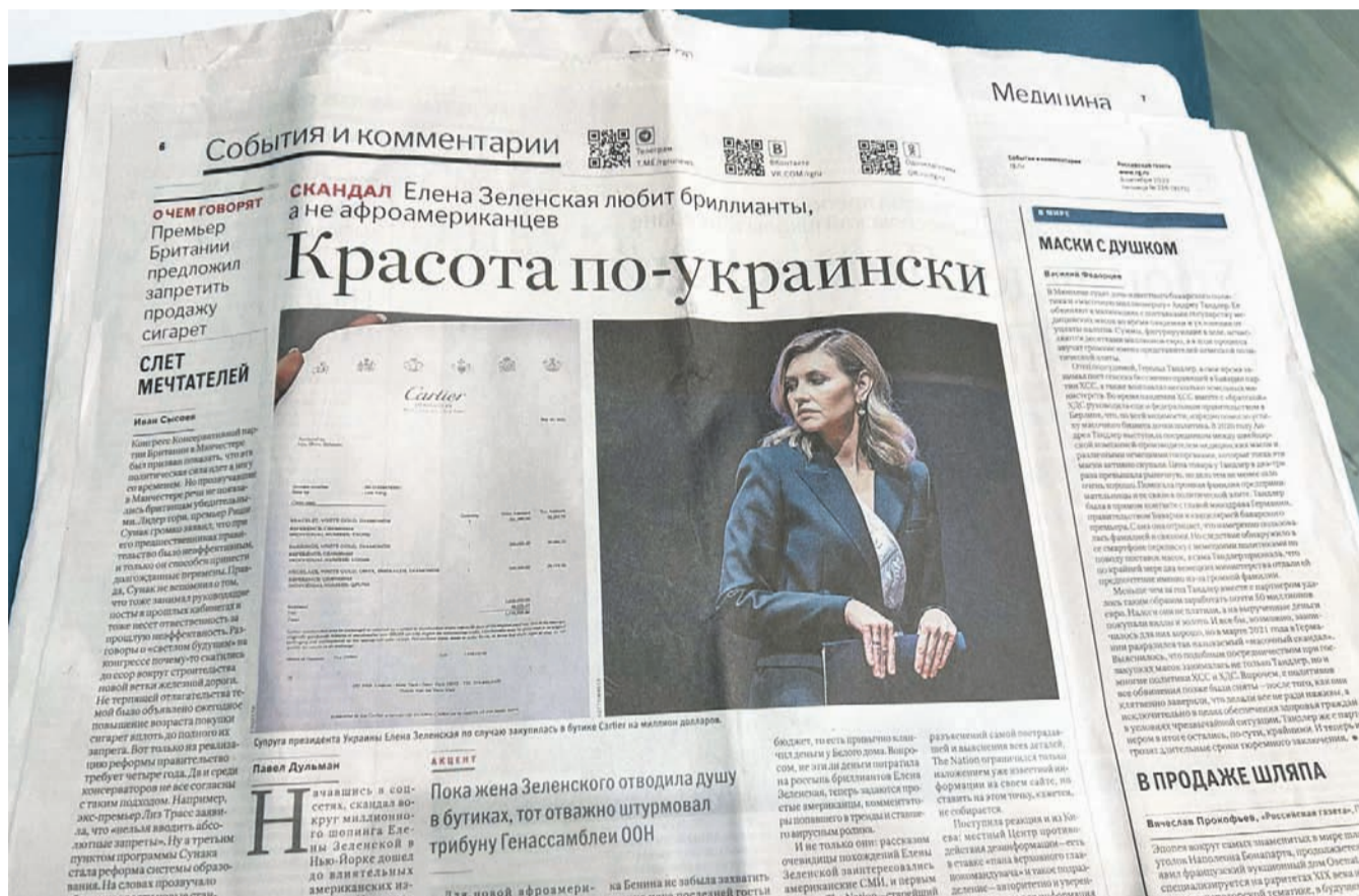
Статья про Елену Зеленскую в «Российской газете»

КАК ЖЕНА ПРЕЗИДЕНТА НЕ ПОКУПАЛА ЮВЕЛИРНЫЕ УКРАШЕНИЯ ЗА 1,1 МЛН ДОЛЛАРОВ. ИСТОРИЯ ОДНОГО ФЕЙКА